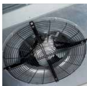
Defensa de aspiración