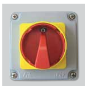
Interruptor opcional paro-marcha de seguridad, IP65, F400, instalado en fábrica o como accesorio.