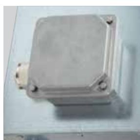
Caja de conexiones exterior para facilitar la instalación.