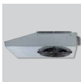
Bajo perfil para trabajar en aparcamientos de baja altura.